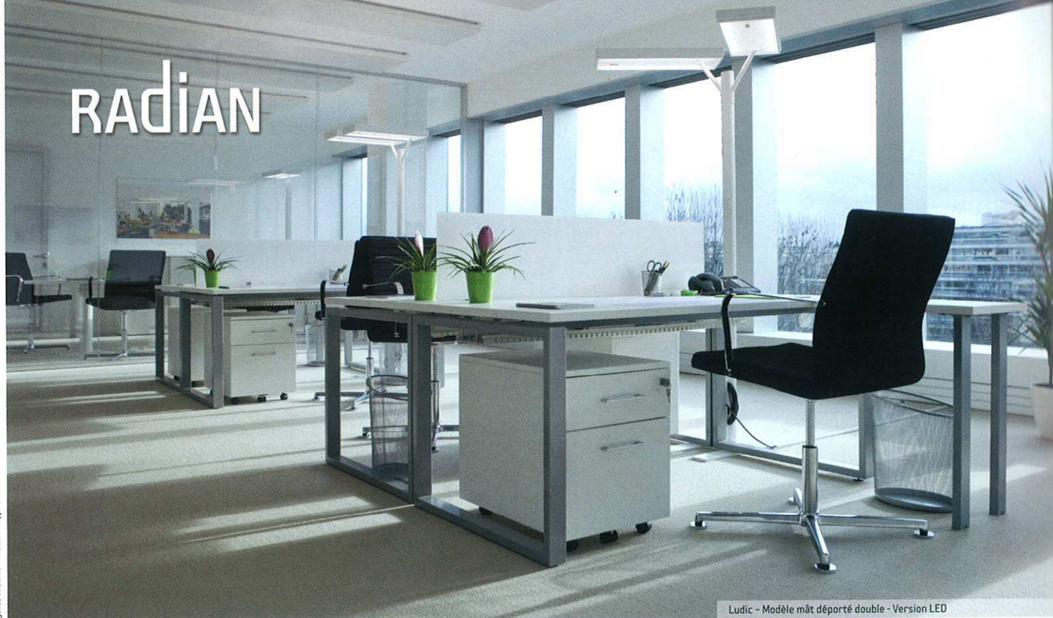
Ludic - Modèle mât déporté double - Version LED

Agence Thélène